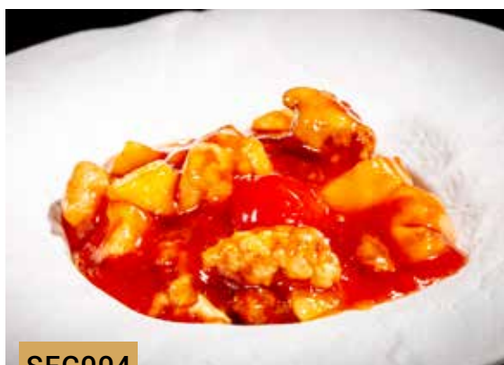
POLLO PICCANTE 🌶️